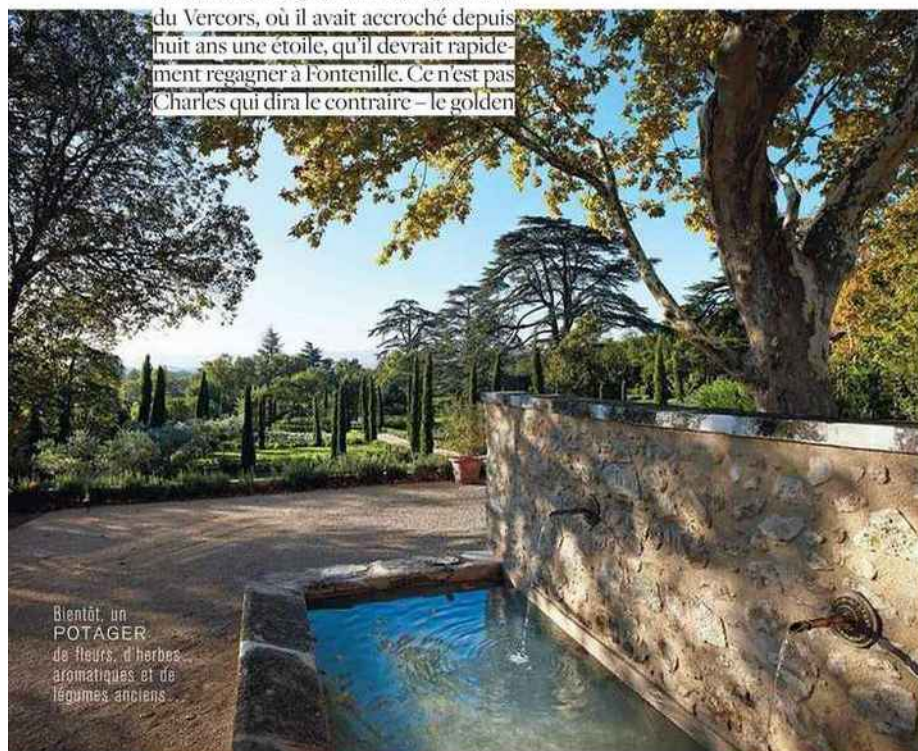
Bientôt, un POTAGER de fleurs, d'herbes aromatiques et de légumes anciens.

retrouver de la maison déguste les queues des langoustines et des tartines de beurre manié à la framboise, sous le regard attendri de ses deux papas. Cet enfant gâté souffre hélas d'un cancer, et il aura certainement pris une dizaine de kilos d'ici à son passage dans l'autre monde, mais qu'importe.