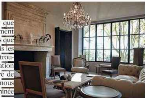
Le coin salon-cheminée où se retrouver pour L'APÉRO.